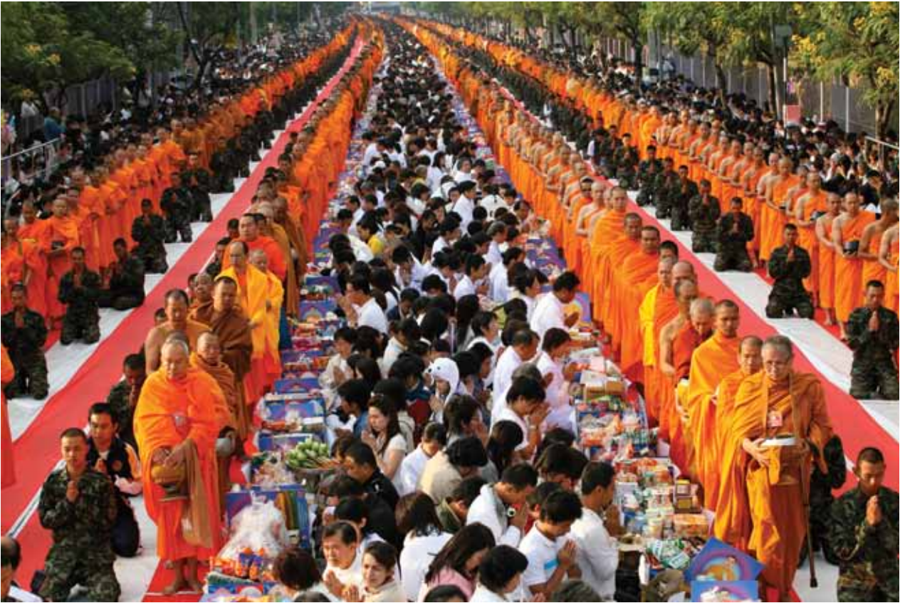
ตักบาตรพระ 12,500 รูป อ.เมือง จ.เชียงใหม่ ธันวาคม 2551