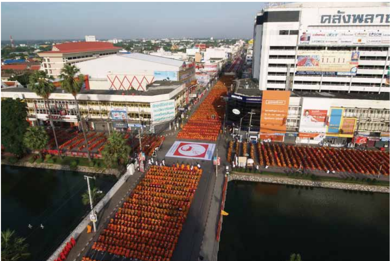
ตักบาตรพระ 11,111 รูป อ.เมือง จ.นครราชสีมา กรกฎาคม 2551