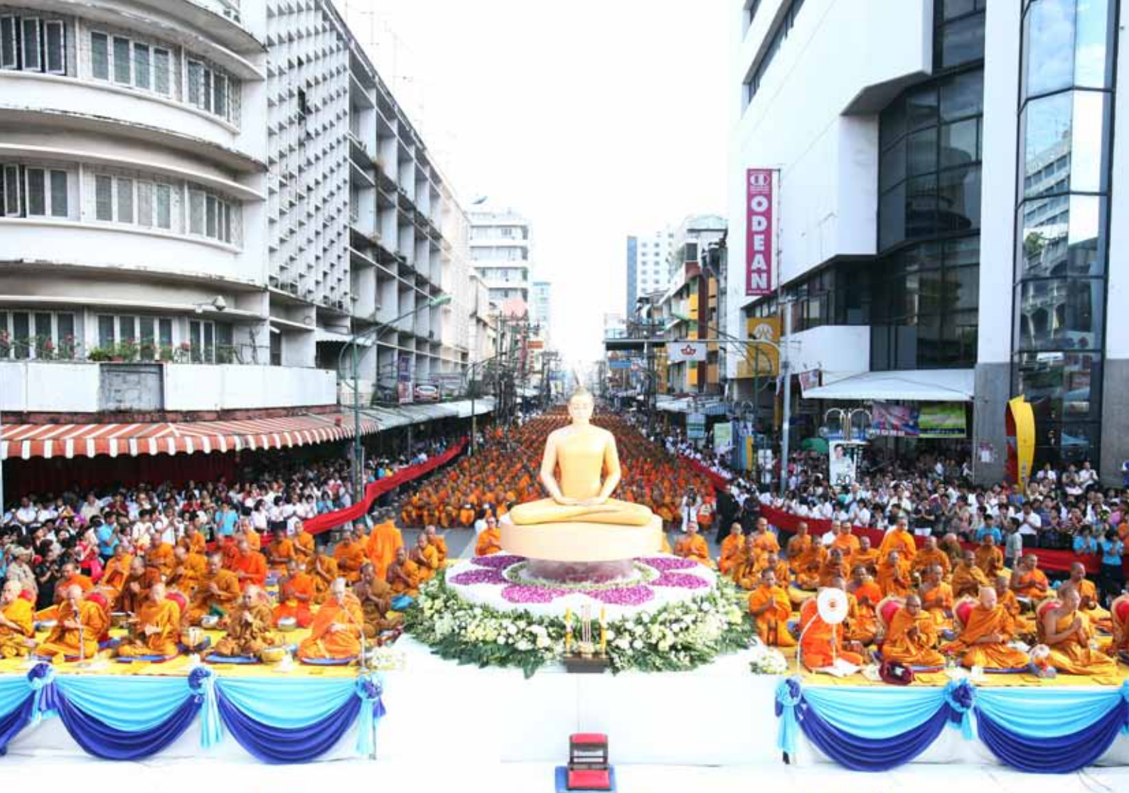
พิธีตักบาตรพระ 12,600 รูป นานาชาติ ใจกลางนครหาดใหญ่ ปีที่ 11