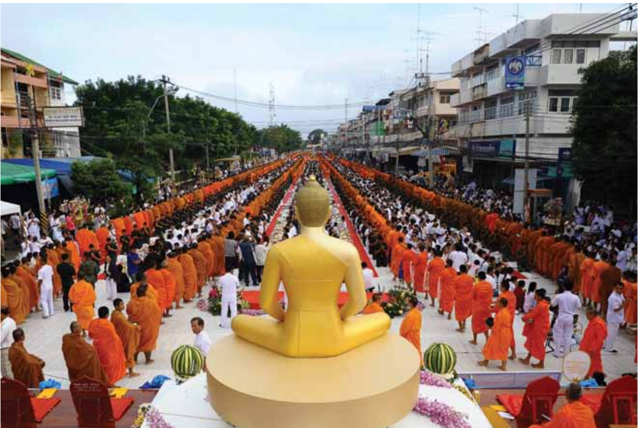
ตักบาตรพระ 10,000 รูป จ.ราชบุรี ตุลาคม 2553