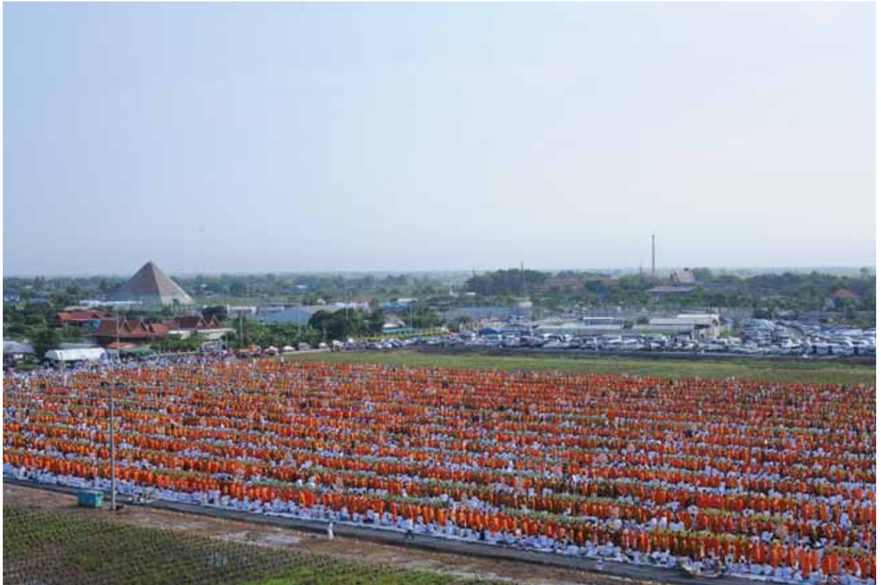
ตักบาตรพระ 10,000 รูป จ.สุพรรณบุรี ตุลาคม 2552