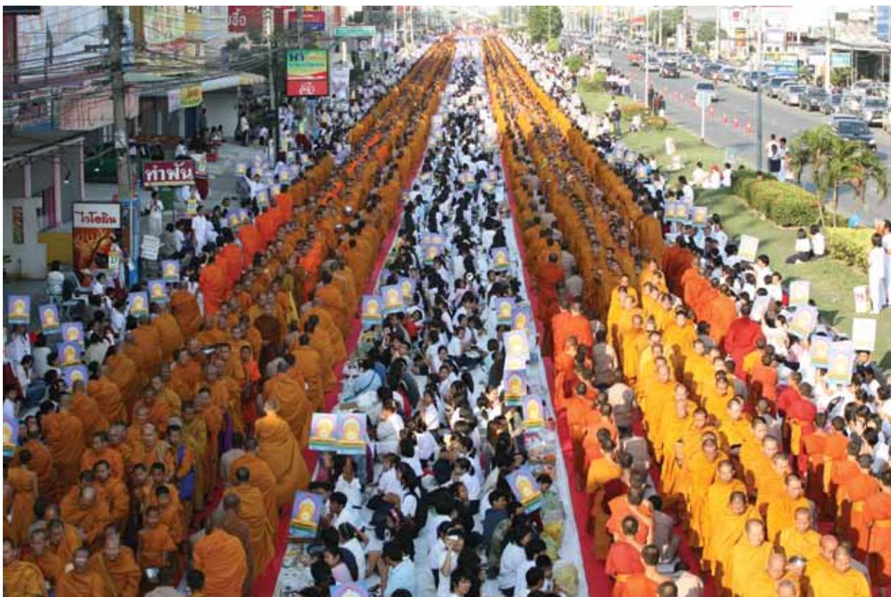
ตักบาตรพระ 10,000 รูป จ.ระยอง พฤศจิกายน 2551