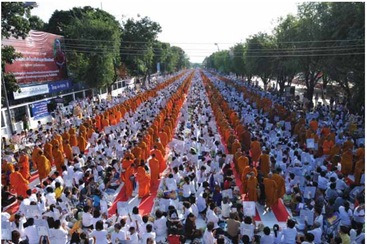
ตักบาตรพระ 10,000 รูป อ.เมือง จ.ขอนแก่น พฤศจิกายน 2552