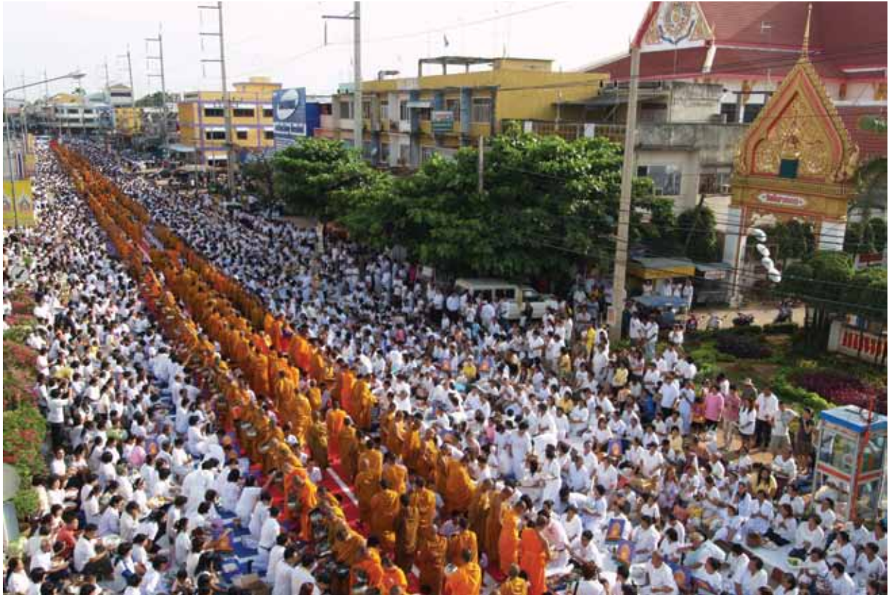
ตักบาตรพระ 10,000 รูป จ.ชัยภูมิ กรกฎาคม 2551