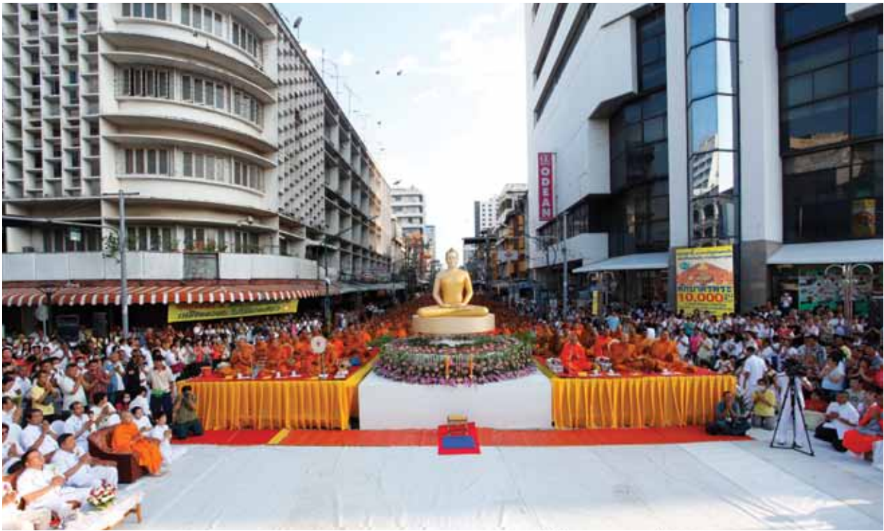
ดักบาตรพระ 10,000 รูป อ.หาดใหญ่ จ.สงขลา สิงหาคม 2552