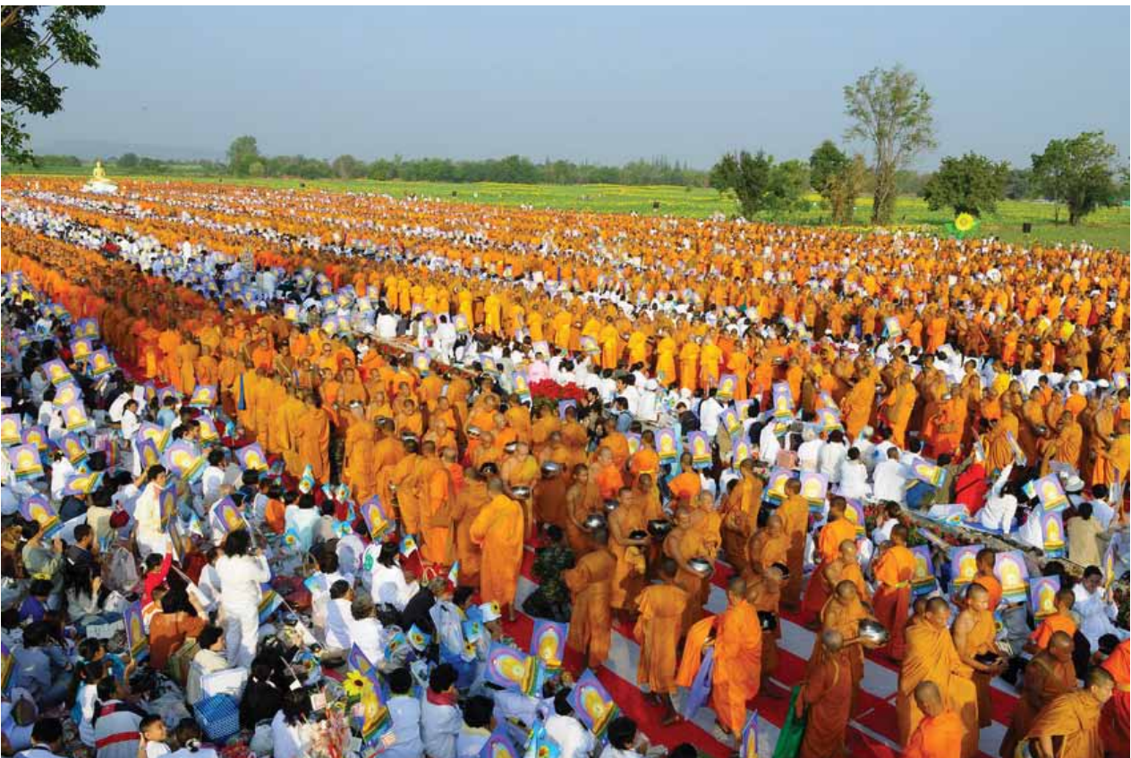
ตักบาตรพระ 10,000 รูป ทุ่งธารตะวัน จ.ลพบุรี ธันวาคม 2551