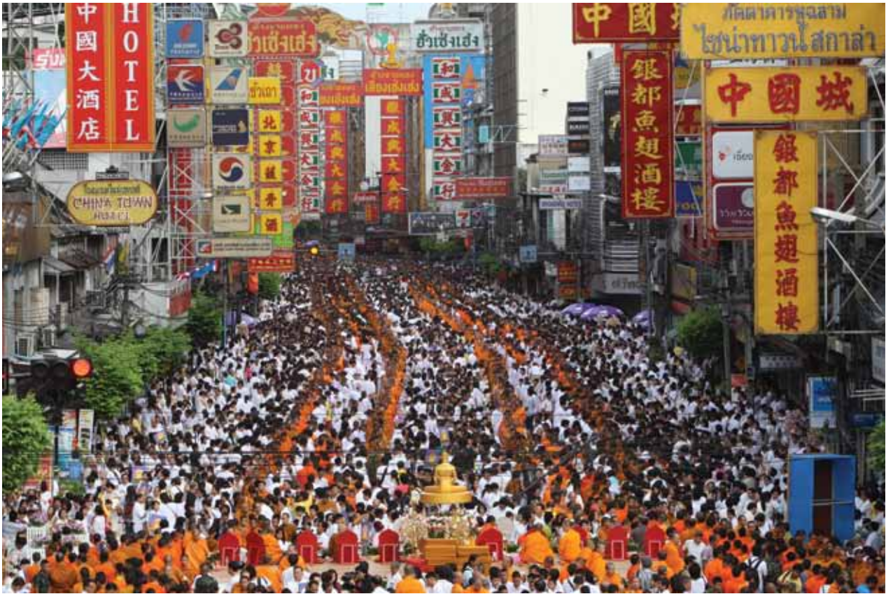
ตักบาตรพระ 11,111 รูป ถนนเยาวราช กทม. สิงหาคม 2551