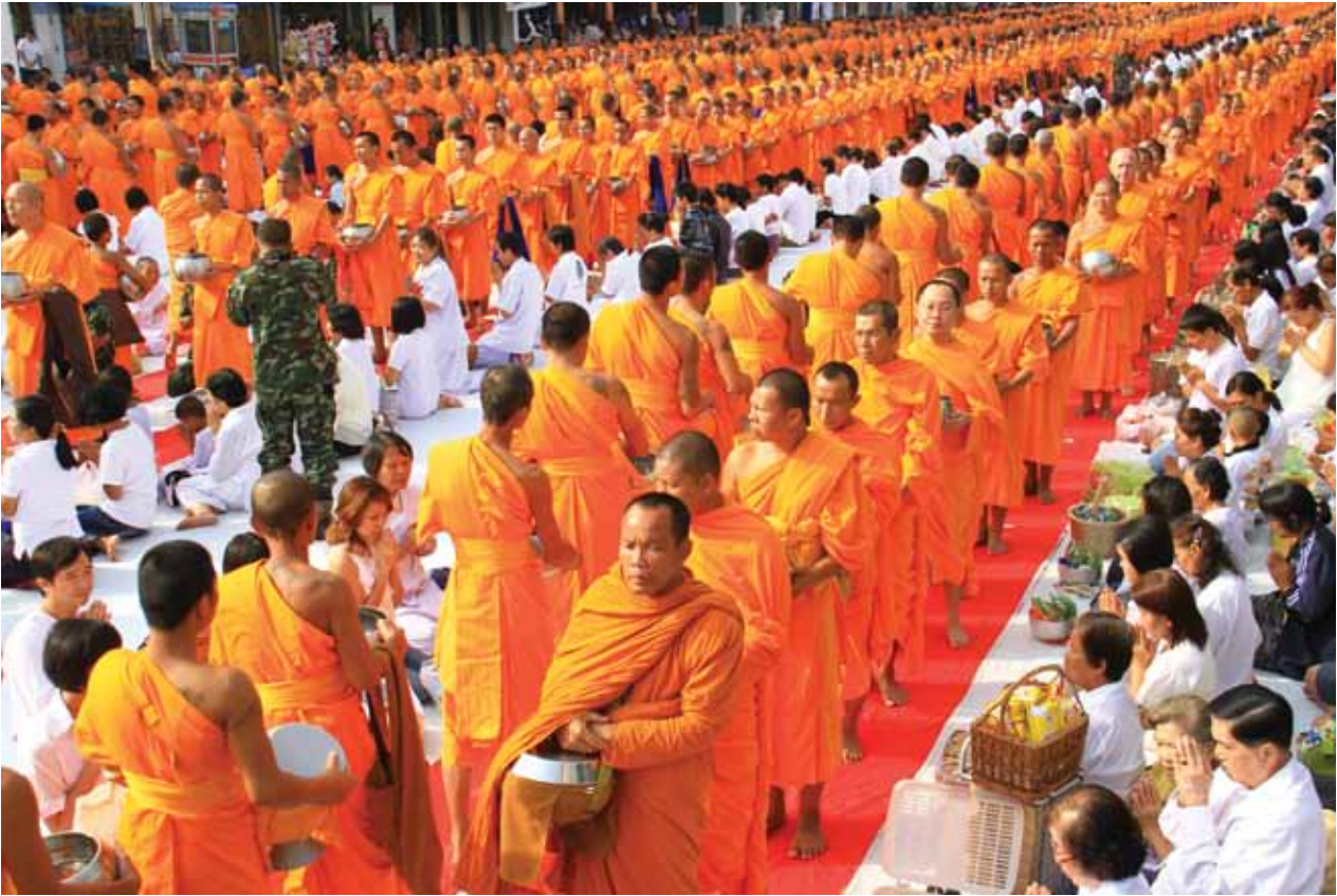
ตักบาตรพระ 10,000 รูป จ.สกลนคร ตุลาคม 2553