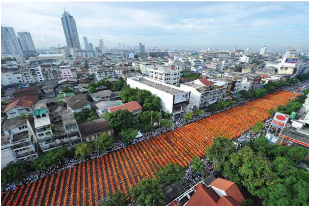
ดักบาตรพระ 10,000 รูป วงเวียนใหญ่ จ.กรุงเทพฯ ตุลาคม 2552