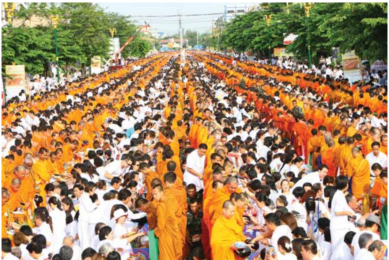
ตักบาตรพระ 12,500 รูป อ.เมือง จ.ปทุมธานี กรกฎาคม 2552