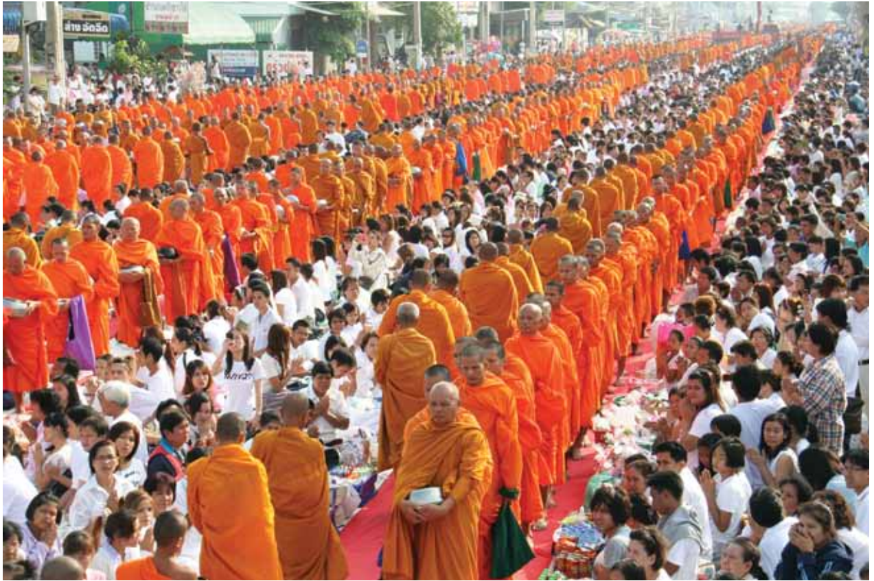
ตักบาตรพระ 10,000 รูป จ.สมุทรสาคร ตุลาคม 2553