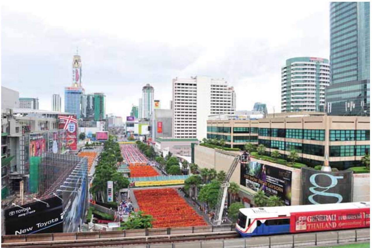
ตักบาตรพระ 12,600 รูป ถ.ราชดำริ กรุงเทพฯ พฤษภาคม 2554