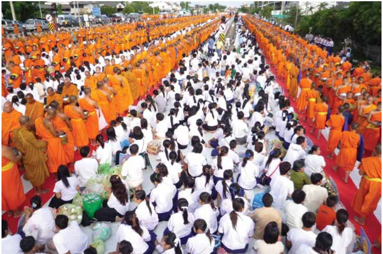
ตักบาตรพระ 22,222 รูป อ.เมือง จ.ลำพูน กรกฎาคม 2552